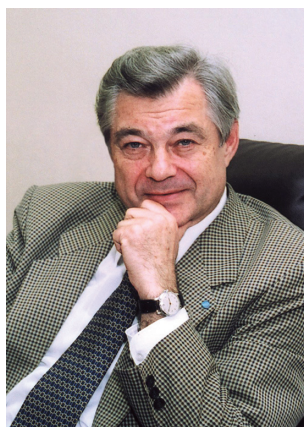
Рис. 3. Академик Григорьев А. И.