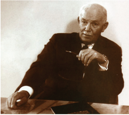
Рис. 1. Академик Парин В. В.

космической кардиологии», где рассматривалась роль реакций системы кровообращения в приспособлении организма к условиям невесомости. Показано, что ведущее значение при этом принадлежит вегетативной нервной системе и что основным методом изучения вегетативной регуляции кровообращения является анализ variability сердечного ритма (ВСР). Этот метод, который получил затем широкое применение в различных областях медицины, фактически «родился» в космической кардиологии. В 1967 г. вышла монография Парина В. В., Баевского Р. М., Волкова Ю. Н. и Газенко О. Г. «Космическая кардиология». В этой книге обобщен широкий круг проблем, связанных с влиянием факторов космического полета на систему кровообращения. При этом сердечно-сосудистая система рассматривается как индикатор адаптационных реакций целостного организма. На основе обобщения результатов первых космических полетов был сформулирован ряд важных научно-теоретических положений, имеющих концептуальный характер и во многом определивших дальнейшее развитие космической кардиологии.