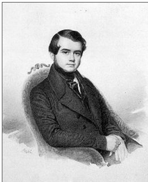
Соллогуб Владимир Александрович

Из записок Соллогуба: «Много видел я красивых женщин на веку своем. Много встречал женщин еще обаятельнее, но никогда» причем «Не видывал женщины, которая соединяла бы в себе, такую законченность Классически правильных черт и стана, — отмечал молодой поэт гость, —