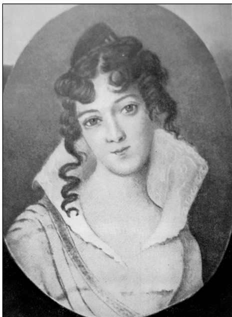
Наталья Ивановна Гончарова