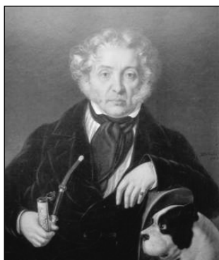
Граф Федор Толстой

Александр Пушкин из Арзрума и армии Паскевича и из поездки по Кавказу в сентябре 1829 года вернулся в Москву и к Гончаровым отправился сразу... Поэт до своего отъезда на Кавказ Наталью Гончарову сватать пытался... И хорошо, что ее мать свата его обнадежила, поэт ведь худшего опасался... А сватом был Федор Толстой, который в 1820 году, и, это известно, О поэте в столице гнусную клевету пустил, будто тот наказан телесно За политические стихи... И поэт, уже находясь в ссылке, надо думать, Стремился в Москву, чтобы своего обидчика-бретера на дуэль вызвать. Но после ссылки, в сентябре 1826 года, Пушкина с Толстым примирили... Ну а в апреле 1829 года свата от поэта довольно сдержанно приняли... Мать Наташи знала, что не лучшая репутация у него в свете... К тому ж И хороший поэт — это не обязательно, по мнению Гончаровой, хороший муж.