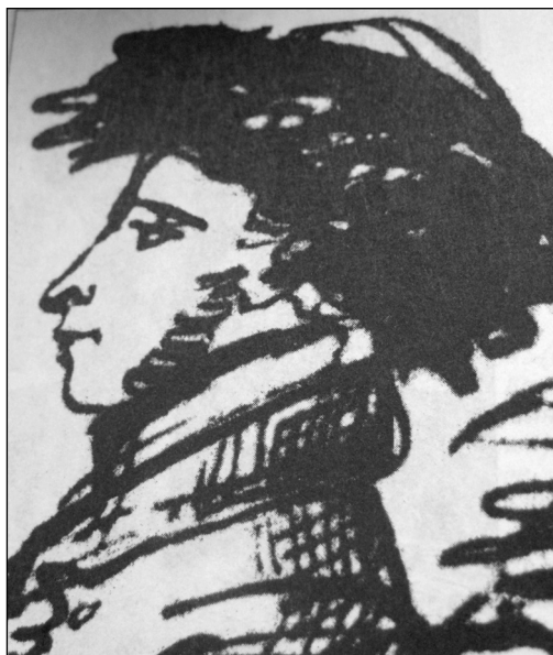
Александр Пушкин (автопортрет)