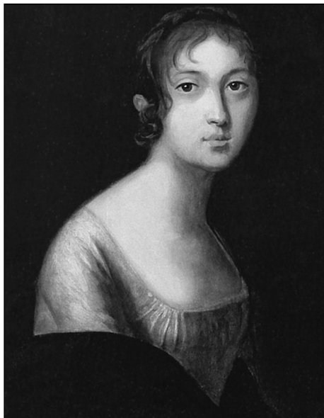
Наталья Ивановна Гончарова