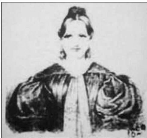
Прасковья Осипова-Вульф в молодости

Да, Пушкин влюблен в Натали, но видеть его мужем дочери не спешит Мадам Гончарова... И значит «донжуановский список» поэта не закрыт... И, проведя три недели у Катеньки Ушаковой, он ищет впечатлений новых. И поэт едет в деревню Малинники, где был целый цветник чаровниц юных. Малинники родовым поместьем Осиповой-Вульф приходились... А с этой семьей у Пушкина дружеские связи с юности поддерживались. Но он, мечтавший о шалостях, чтобы забыть обиду на мадам Гончарову, Сочиняет VIII главу романа «Евгений Онегин» и стихи о зиме, к слову... Так, стихотворение «Зимнее утро» 3 ноября 1829 года написано поэтом В имении дяди Алексея Вульфа, друга Пушкина, расположенном Близ Малинников, и в альманахе «Царское село» за 1830 год напечатано... Это лучшее стихотворение Пушкина о русской зиме... Вот оно: