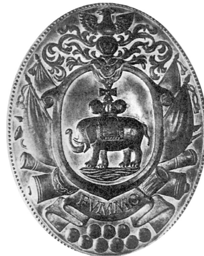
Герб рода Ганнибалов