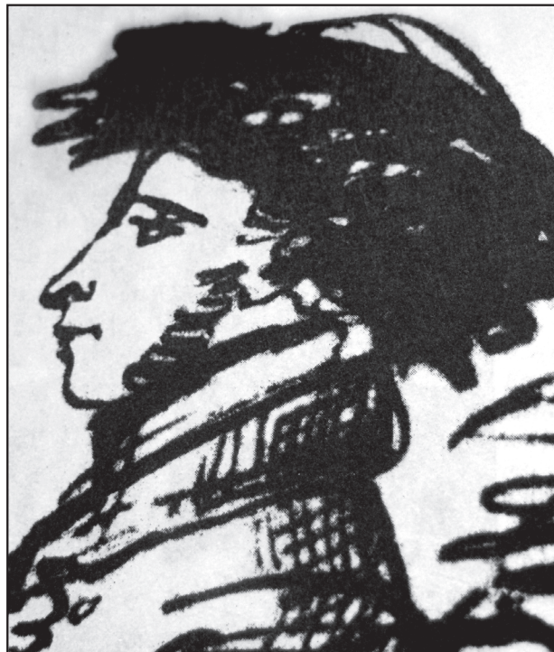
Александр Пушкин (автопортрет)